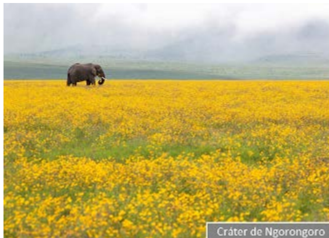
Cráter de Ngorongoro

Es la mejor bienvenida posible de la fauna africana. El Cráter del Ngorongoro tiene una altitud de 2200m y un diámetro de aproximadamente 20Km que lo convierten en una de las calderas más grandes del mundo.