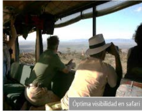
Óptima visibilidad en safari