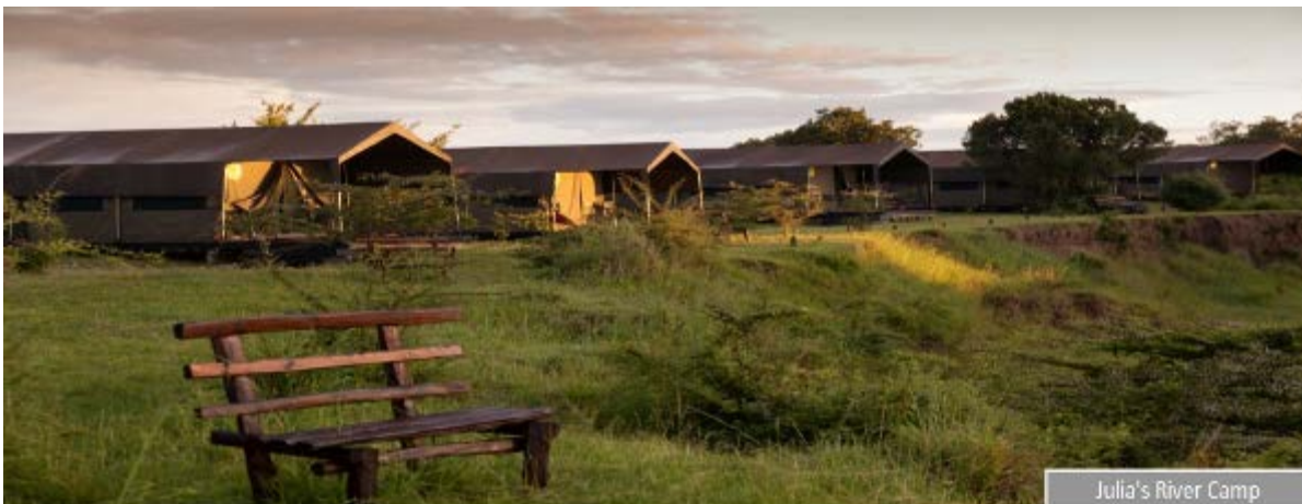
Julia's River Camp

Estas dos jornadas, además de deleitarnos con los mejores safaris, nos permitirán sumergirnos en nuestro entorno al 100%. Al amanecer dejaremos el campamento para recorrer las llanuras de la Reserva Masai Mara y al atardecer volveremos para disfrutar de las noches mágicas oyendo el murmullo del río.