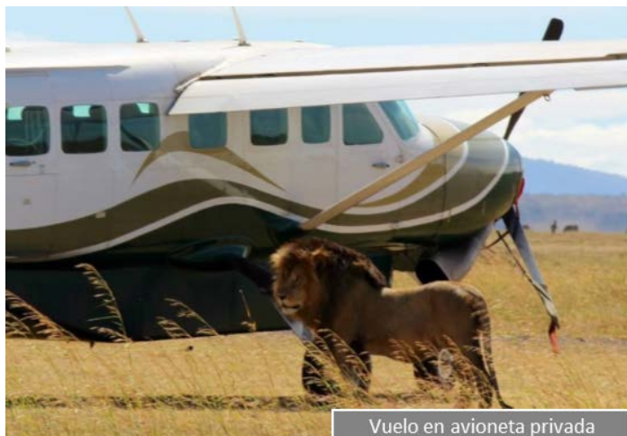
Vuelo en avioneta privada

No sólo los viajeros de las versiones Clásico y Confort tendrán el privilegio de vivir un día 100% Memorias de África . También esta temporada, nuestros viajeros más aventureros gozarán de las mejores vistas desde el aire, con nuestro exclusivo VUELO EN AVIONETA que nos permitirá aprovechar al máximo el tiempo.