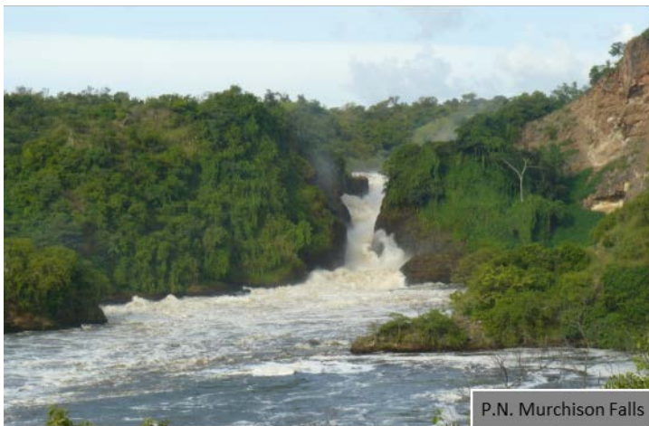
P.N. Murchison Falls

Con sus 3.840 km 2 es el parque más extenso de Uganda. Famoso por sus exuberantes llanuras salpicadas de palmeras, bosques y manadas de animales, uno de los mayores atractivos son los 115 km del río Nilo que lo recorre de este a oeste antes de desembocar en el Lago Alberto. Rodeados de búfalos, hipopótamos, aves multicolores y, como no, los voraces cocodrilos, recorreremos en barca el Nilo Victoria con la vista de las Cataratas Murchison como telón de fondo. Aquí llevaremos a cabo un trek donde las aguas del río rompen en