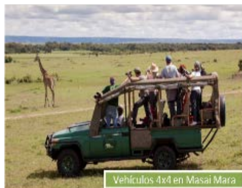
Vehículos 4x4 en Masai Mara

Nuestra flota de vehículos está compuesta por 23 camiones , adaptados en nuestro taller de Arusha, Tanzania para realizar todo tipo de safaris. Es el medio de transporte más versátil y práctico para disfrutar del viaje, dado su campo de visión de 360º para localizar y fotografiar animales. Están equipados con material de acampada (si es necesario), cocina, cargadores para dispositivos electrónicos y almacenaje individual para cada pasajero. No obstante, debido a la orografía del Masai Mara, usaremos vehículos 4x4 que nos llevarán a los rincones más inaccesibles de la reserva. Gracias a nuestra flota de camiones y 4x4 podremos amoldarnos a todas las circunstancias y utilizar en cada caso el transporte más adecuado para que vuestro safari sea absolutamente perfecto.