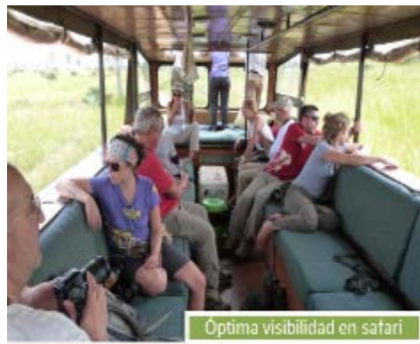
Óptima visibilidad en safari

Nuestra flota de vehículos está compuesta por 23 camiones , adaptados en nuestro taller de Arusha, Tanzania para realizar todo tipo de safaris. Es el medio de transporte más versátil y práctico para disfrutar del viaje, dado su campo de visión de 360º para localizar y fotografiar animales. Están equipados con material de acampada (si es necesario), cocina, cargadores para dispositivos electrónicos y almacenaje individual para cada pasajero. No obstante, debido a la orografía del Masai Mara, usaremos vehículos 4x4 que nos llevarán a los rincones más inaccesibles de la reserva. Gracias a nuestra flota de camiones y 4x4 podremos amoldarnos a todas las circunstancias y utilizar en cada caso el transporte más adecuado para que vuestro safari sea absolutamente perfecto.