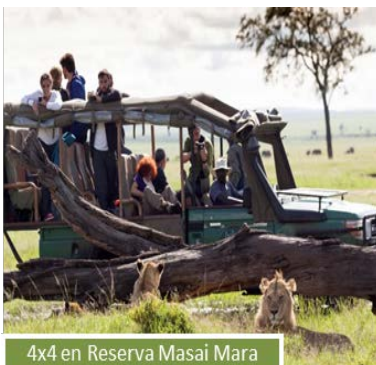
4x4 en Reserva Masai Mara