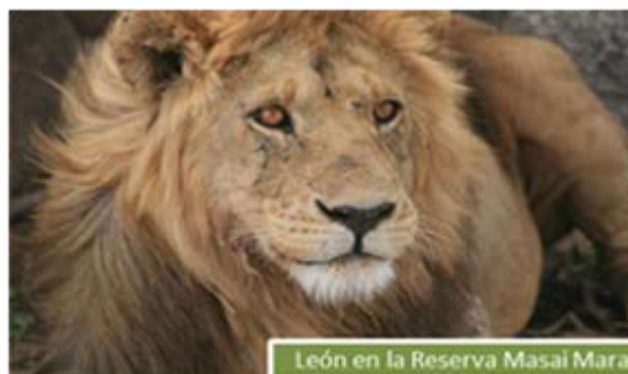
León en la Reserva Masai Mara

Un itinerario ideal para conocer Kenya en pocos días Safaris en la cuna del safari por excelencia Máxima comodidad en ruta sin perder la sensación de aventura Viaje en grupo guiado por nuestros guías profesionales de habla hispana.