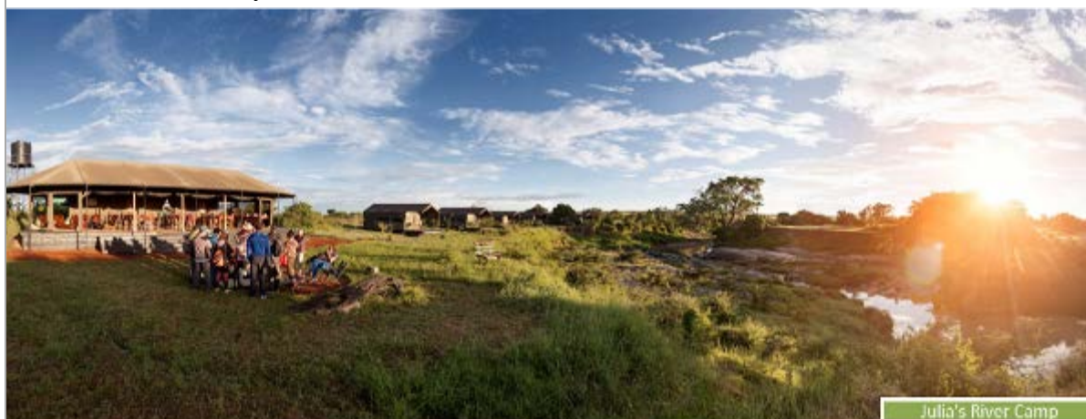
Julia's River Camp

Para conocer a fondo la Reserva, pasaremos 2 noches en nuestro JULIA'S RIVER CAMP , inaugurado en 2012 con motivo de nuestro vigésimo aniversario. Se encuentra a orillas del RÍO TALEK, un paraje fantástico en el que deleitarse mirando la puesta de sol con una copa de vino en la mano. Su estupenda localización, dentro de la Reserva, nos permitirá visitar a nuestros vecinos de la tribu Maasai y aprender sobre sus costumbres ancestrales y su vida cotidiana. Es importante tener en cuenta que estamos dentro de la reserva, a media hora en 4x4 del alojamiento más cercano, donde es fácil avistar elefantes, jirafas e incluso leones. ¡Un auténtico lujo!