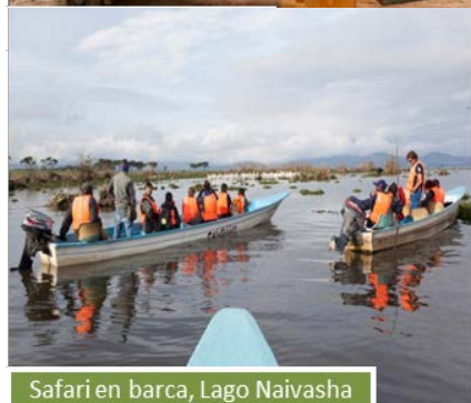
Safari en barca, Lago Naivasha

Para el recorrido dispondremos de un camión especialmente equipado con capacidad para 24 personas, no obstante, como máximo serán 20 pasajeros los que viajen en él. El vehículo ofrece visibilidad 360º para poder avistar y fotografiar a los animales que nos vayamos encontrando.