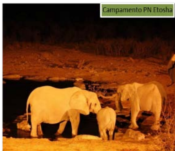
Campamento PN Etosha

Y desde vuestra tienda lo más seguro es que podréis escuchar los animales salvajes de este famoso parque nacional.