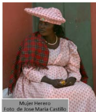
Mujer Herero

Hoy en día, las mujeres herero se reconocen fácilmente por su vestuario que no ha cambiado desde el siglo XVI, cuando los misioneros alemanes les obligaron a vestirse; en esa época las mujeres dejaron sus faldas de piel por largos y amplios vestidos de estilo victoriano. Sus coloridos sombreros imitan la forma de los cuernos de vaca, animal muy importante para ellos, no solo como fuente de riqueza económica sino como parte integral de sus creencias.