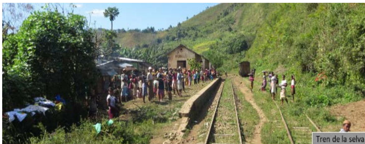
Tren de la selva