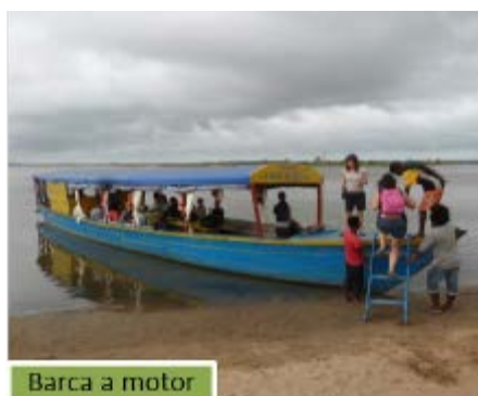
Barca a motor