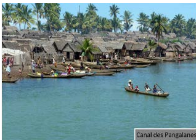
Canal des Pangalanes

Es el más largo del mundo y enlaza lagos naturales y ríos, y es la principal fuente de comercio y transporte. Además, alberga en algunos tramos tranquilas playas vírgenes y aldeas de pescadores. Seremos testigos del lento transcurrir de la vida en los pequeños pueblecitos de pescadores a orillas de los lagos unidos por el canal y que viven de espaldas a la bravura de las olas marinas. Podremos conocer a los habitantes de los pequeños pueblos pescadores situados a