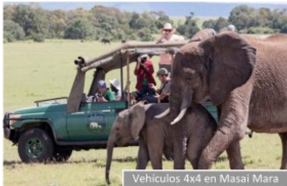
Vehículos 4x4 en Masai Mara

Están equipados con material de acampada (si es necesario), cocina, cargadores para dispositivos electrónicos y almacenaje individual para cada viajero. No obstante, debido a la orografía del Masai Mara, usaremos vehículos 4x4 que nos llevarán a los rincones más inaccesibles de la reserva, así como para bajar a la caldera extinta del Ngorongoro. Gracias a nuestra flota de camiones y 4x4 podremos amoldarnos a todas las circunstancias y utilizar en cada caso el transporte más adecuado para que vuestro safari sea absolutamente perfecto.