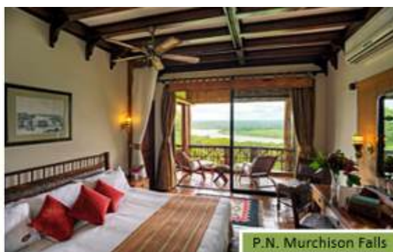
P.N. Murchison Falls