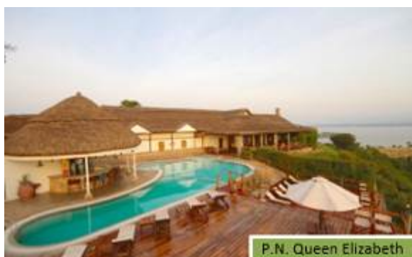
P.N. Queen Elizabeth

Un año más, hemos trabajado para alojarnos en los Lodges más especiales y exclusivos del país; solamente las 2 noches en el Wildwaters Lodge y la noche en Ishasha Wilderness Camp están valoradas en 1.500$ por persona .