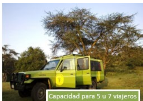
Capacidad para 5 u 7 viajeros