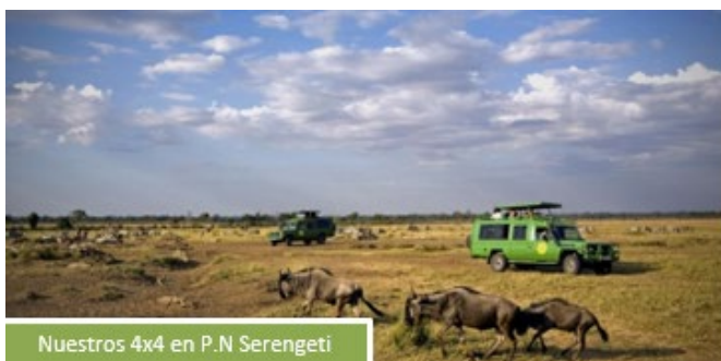
Nuestros 4x4 en P.N Serengeti