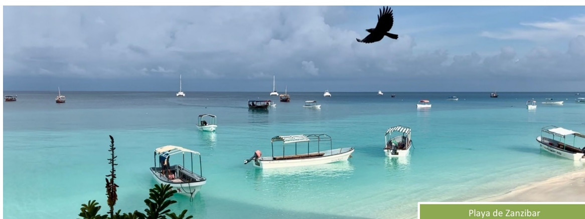
Playa de Zanzibar

Gozaremos de una mágica estancia que combina las comodidades que ofrece nuestro alojamiento con un entorno de playas de arena blanca, agua color turquesa y fondo marino exquisito; podremos practicar snorkeling, submarinismo, pesca, paseos en dhow o relajarnos en la arena y disfrutar del relax que nos ofrecen estos días de máxima desconexión en el norte de la isla. Neptune Pwani 5* , todo incluido o similar.